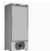
INOX Codice: 116013