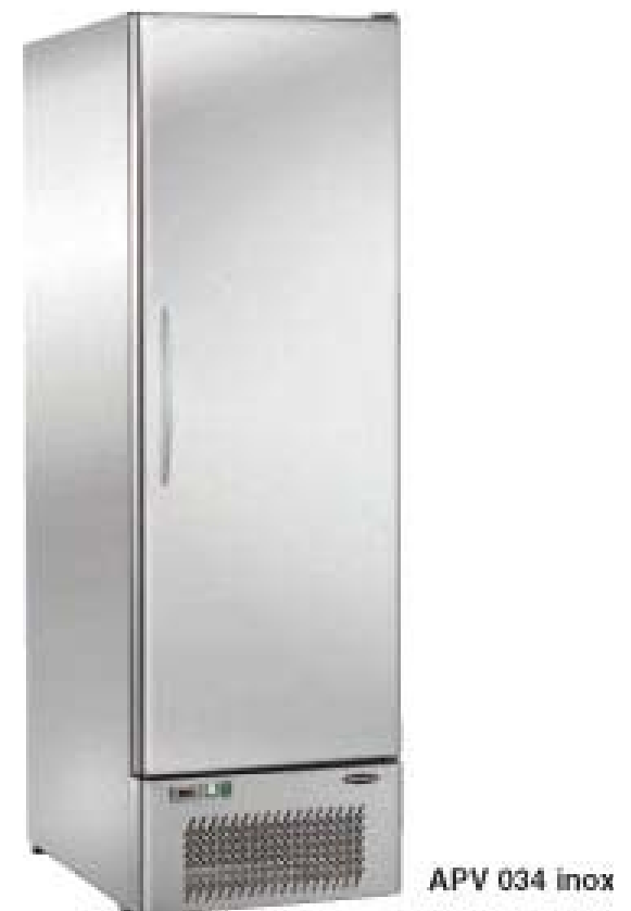
APV 034 inox

Voltaggio 230V /50Hz/1 con impianto elettrico secondo norme CE. Sono disponibili su richiesta anche versioni con alimentazione a 115V/60Hz oppure a 230V/60Hz